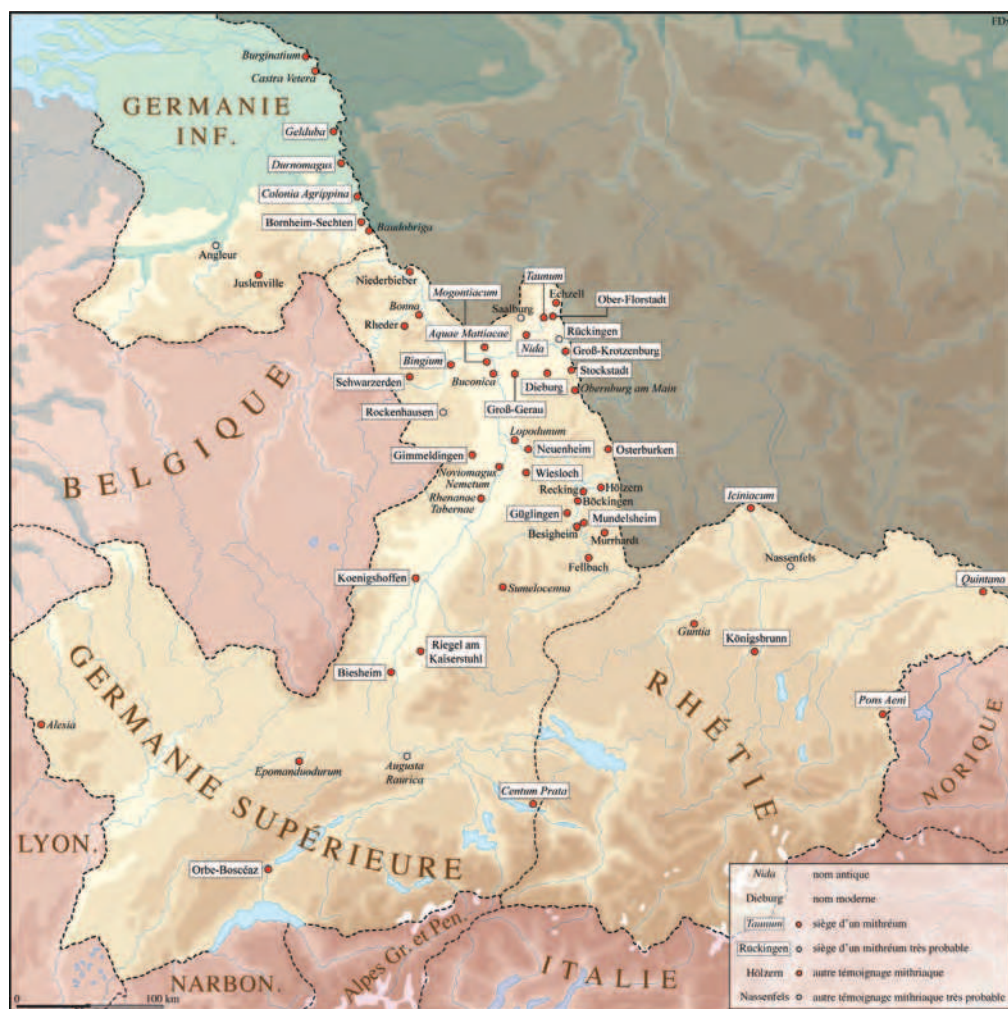
Fig. 1 Carte de répartition des témoignages mithriaques dans les Germanies et en Rhétie.