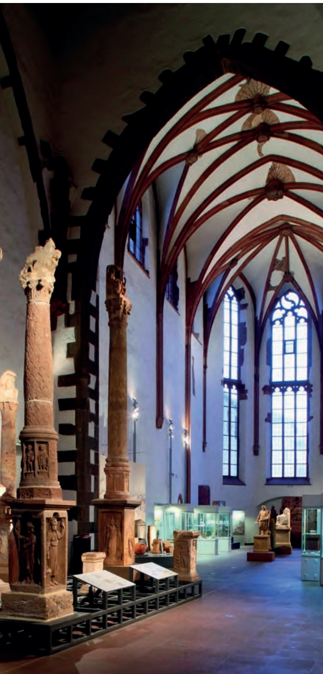
Les antiquités romaines de l'Archäologisches Museum Frankfurt.

L'Archäologisches Museum Frankfurt s'est détaché en 1937 de l'Historisches Museum Frankfurt. Depuis 1989, il prend place dans l'ancien monastère des Carmélites, à l'ouest du centre-ville historique. L'église Sainte-Marie rattachée au monastère a été édifiée à la fin du XIII e siècle, puis agrandie au XV e siècle selon le style gothique tardif. Après avoir été désacralisée au début du XIX e siècle, puis détruite en 1944 durant la guerre, elle a été reconstruite et s'est dotée d'une extension de style postmoderniste afin d'être utilisée comme musée par Josef Paul Kleihues (1933-2004).