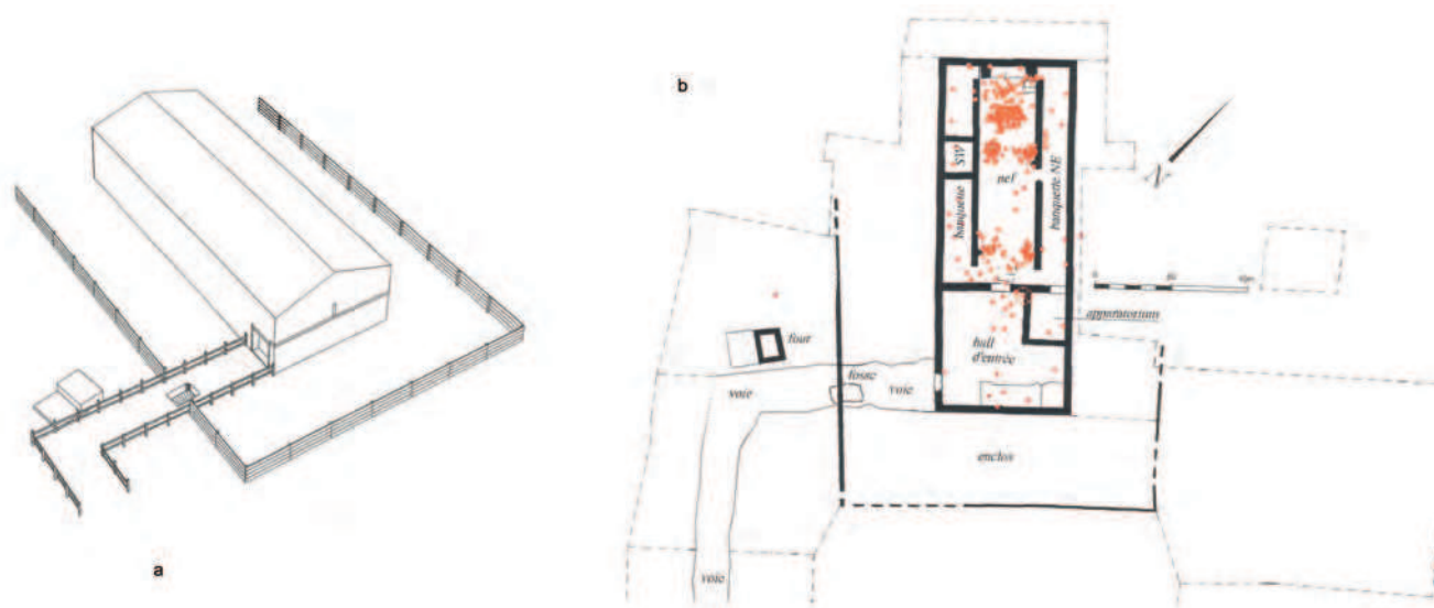
Fig. 3 Mithréum de Martigny-la-Romaine ( Forum Claudii Vallensium ) : a) reconstitution du sanctuaire et de son enceinte ; b) répartition spatiale des monnaies frappées entre 378 et 402. D'après WIBLÉ 2008, 146, fig. 172, et 157, fig. 189.