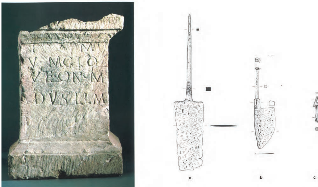
Fig. 5 Mithréum de Künzing ( Quintana ) : autel dédié à l'invincible Mithra par un vétéran et objets en fer trouvés dans l'abside du sanctuaire ([a] fragment d'une épée et de sa poignée ; [b] couteau à large lame ; [c] pointe de flèche). D'après SCHMOTZ 1999, 95, fig. 79 et SCHMOTZ 2000, 135, fig. 15.