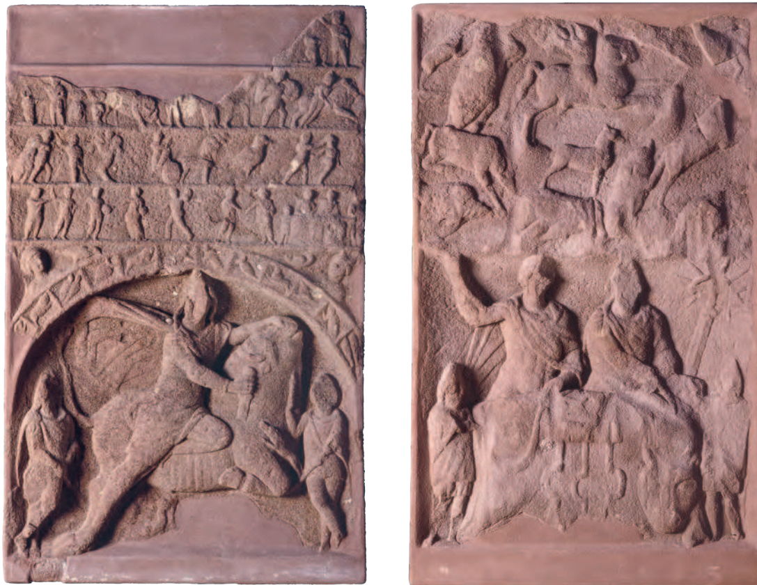
Fig. 2 Relief biface en grès, Erlensee-Rückingen, II e ou III e s. apr. J.-C. Hanau, Städtische Museen, inv. A 2878.

Les découvertes précoces de reliefs mithriaques remarquables (Frankfurt-Heddernheim en 1826 [Cat. II.1], Heidelberg-Neuenheim en 1838 et Osterburken en 1861) 3 ont conféré une importance particulière à la Germanie Supérieure, et ce dès les travaux fondamentaux de Franz Cumont. Les reliefs historiés et bifaces de Frankfurt-Heddernheim ( Nida ), Erlensee-Rückingen (fig. 2), Stockstadt et Dieburg (Cat. II.2), mis au jour à quelques dizaines de km les uns des autres sur la rive gauche du Rhin ou dans l'arrière-pays du limes , ont souvent été illustrés et commentés dans la littérature savante 4 . Les mithréums de Frankfurt-Heddernheim, Stockstadt, Dieburg et Friedberg ont aussi livré de nombreux monuments de pierre et une grande quantité de petits objets. Plus à l'ouest, d'autres mithréums richement aménagés ont été trouvés à Koenigshoffen, une banlieue d' Argentorate , ou à Sarrebourg ( Pons Saravi ), dans la province voisine de Gaule Belgique 5 . Le plus méridional de ces grands reliefs a été découvert dès 1589 au sud du col du Brenner, dans le Haut-Adige, dans la vallée de l' Eisack ( Isarcus ), entre Sterzing ( Vipitenum ) et Franzensfeste (Fortezza, près de Maults) 6 .