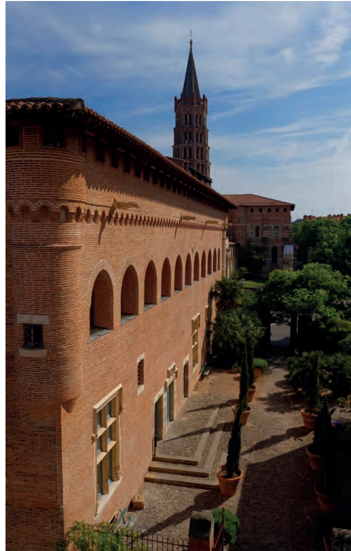
La façade méridionale du musée Saint-Raymond.

Directrice du musée Saint-Raymond de Toulouse